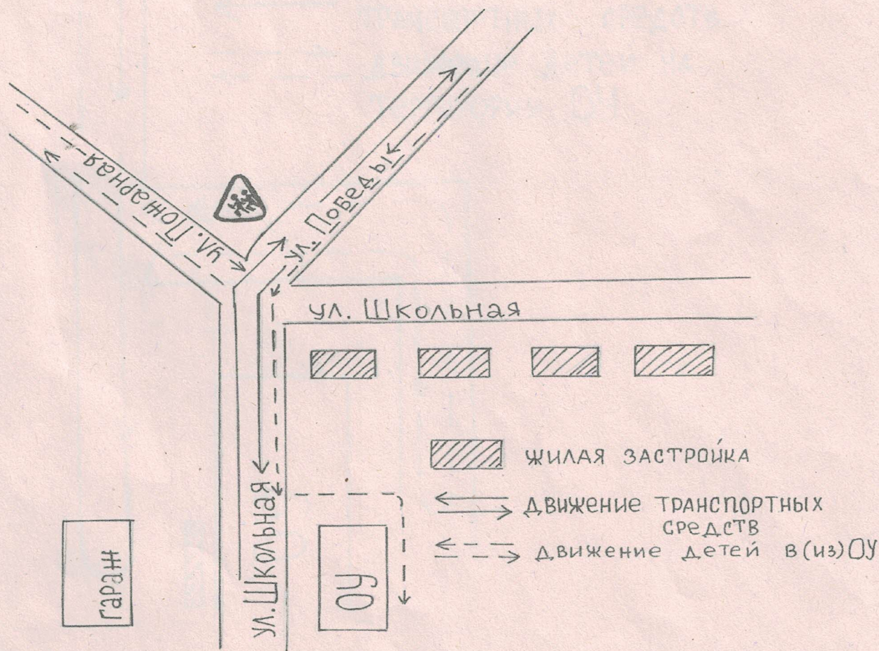
Схема организации дорожного движения в непосредственной близости от МОУ Лахколампинская СОШ с размещением соответствующих технических средств, маршруты движения детей и расположение парковочных мест